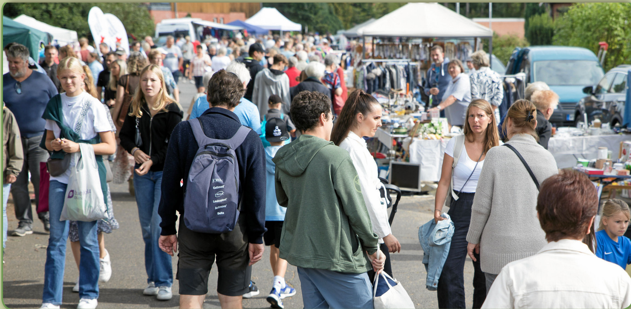
Rund 200 Flohmarktstände lockten im vergangenen Jahr die Besucher nach Luhdorf.